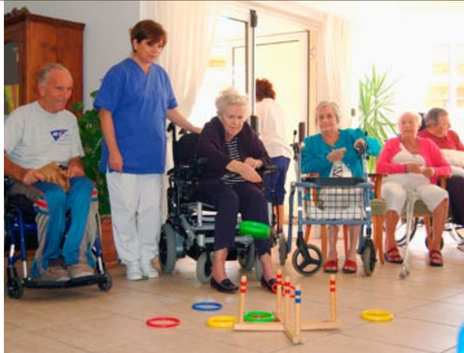
Trim med ball og ringspill er en populær aktivitet.

- Jeg er overbevist på om at søkermassen av ressurspersoner hadde endret seg om det ble større fokus på aktivitet og mental stimulering. En liten endring av fokus ville gjøre det interessant å jobbe innen geriatri, avslutter Wolfe.