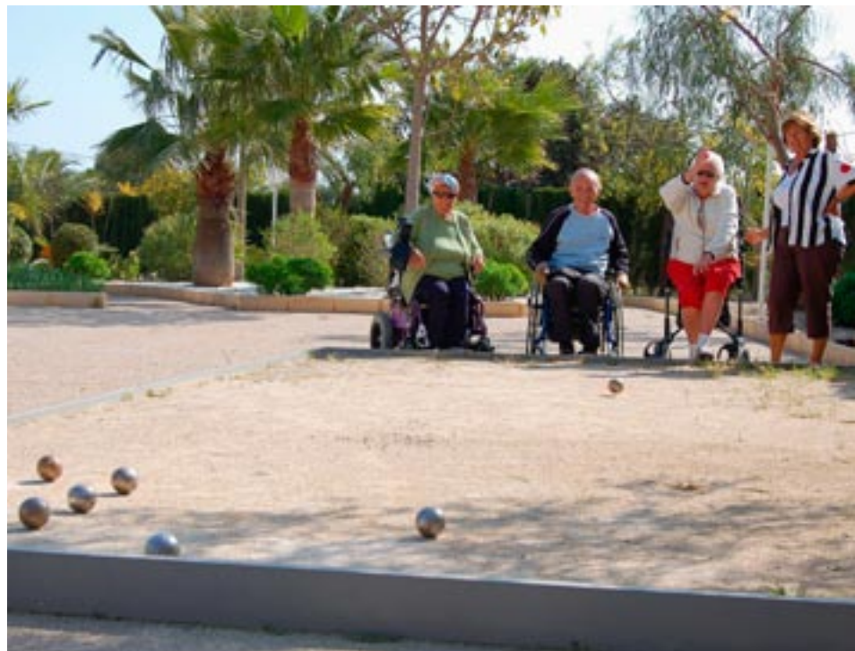
Treningen til boccia-turneringen har begynt.