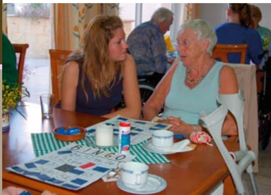
Et slag bingo kan også føre til gode samtaler.