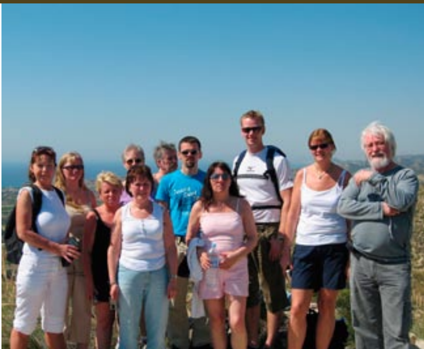
I mai 2006 var hovedkjøkkenet, renholdsavdelingen og teknisk avdeling på internundervisning i Alfaz del Pi, Spania.

- De tilbakemeldingene vi har fått er at man får mye ut av å være sammen både sosialt og faglig, forteller Ørpetveit.