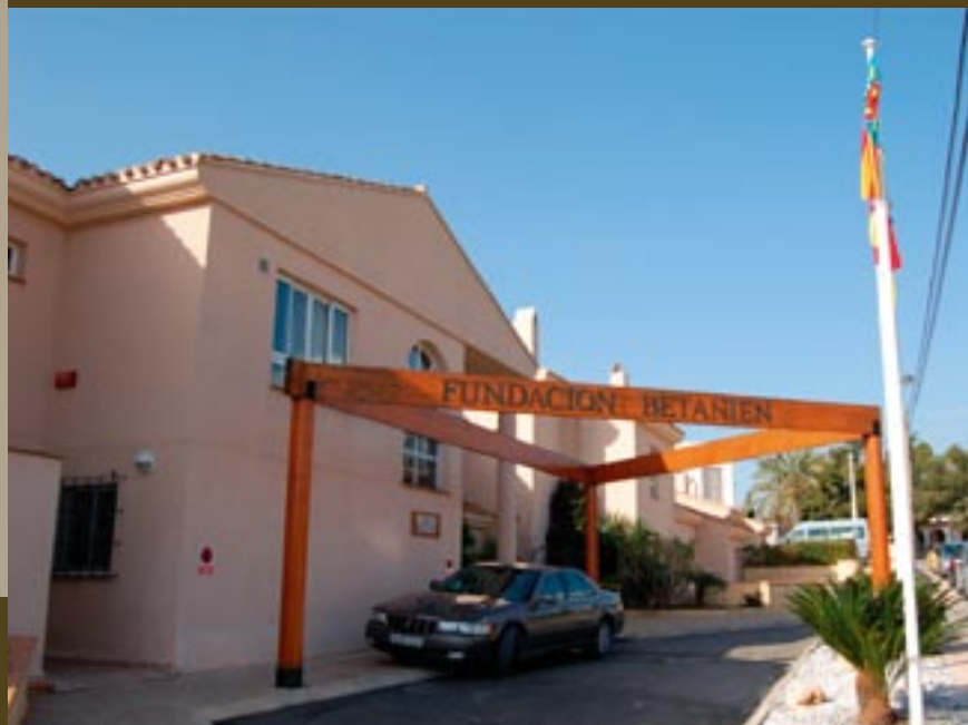
Inngangspartiet til Fundacion Betanien i Alfaz del Pi, Spania.