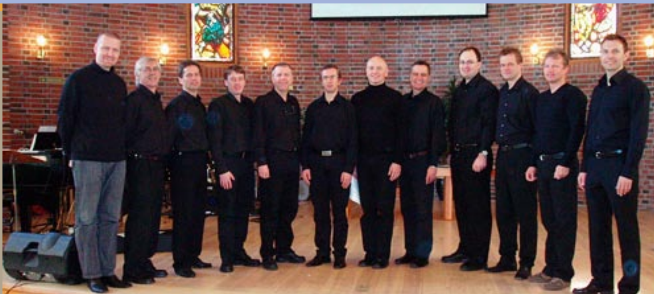
Mannskoret X-Lars fra Frikirken skal synge for oss på vårofferdagen.

Onsdag 21.- søndag 24. juni ÅRSKONFERANSE i Porsgrunn.