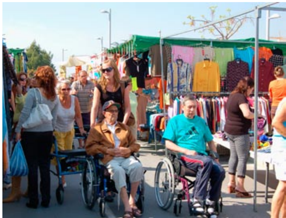
Fredagstur til markedet i Alfaz del Pi.