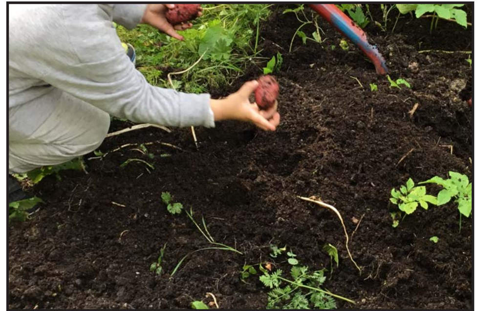
Her settes det poteter

Hvem har skapt alle blomstene, blomstene, blomstene? Hvem har skapt alle blomstene? Jo Gud i himmelen.