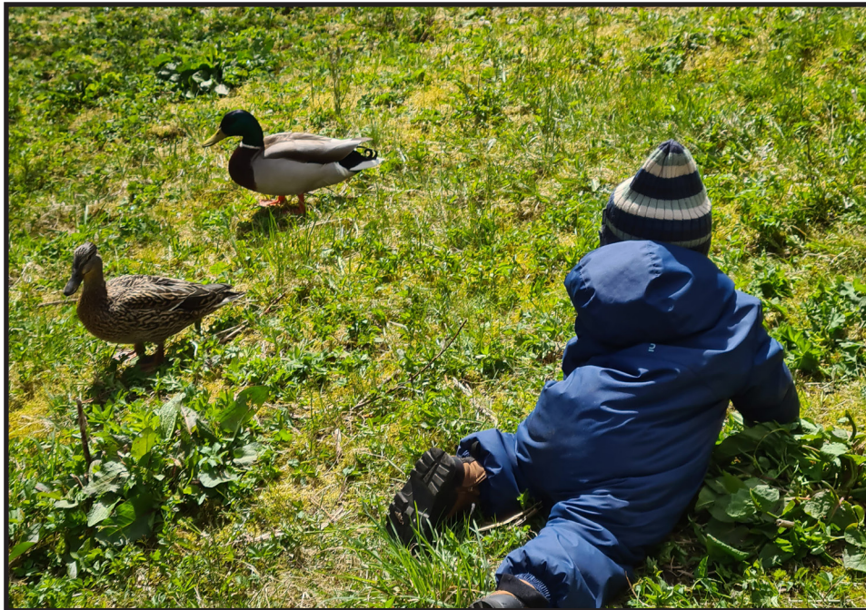
Hver vår får vi besøk av et andepar

Den 12. mars er det barnehagedagen. Barnehagedagen markeres hvert år. Vi setter fokus på ulike temaer. Målet er å synliggjøre hva barna får oppleve, erfare og lære i barnehagen. Vi forbereder oss til påsken ved å fortelle påskeevangeliet. Dramatiserer, synger påskesanger og har påskeaktiviteter. De eldste barna, rips, bringebær og jordbær, går opp i kirken. I slutten av mars setter vi i gang med kjøkkenhagen. Vi planter frø inne og setter opp plantelys slik at plantene får den beste starten på sin spiring.