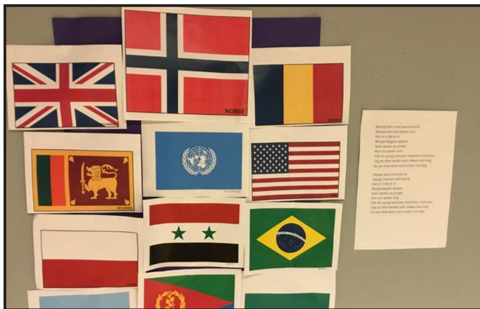
Flagg fra ulike land

Lille Bukken Bruse tripper over Trollebru. Nå tar jeg deg, sa trollet og var så grum i hu. Nei, nei, nei, ta ikke meg, jeg er tynn og liten jeg. Den som kommer etter, mye mere metter. Så gå da, sa trollet