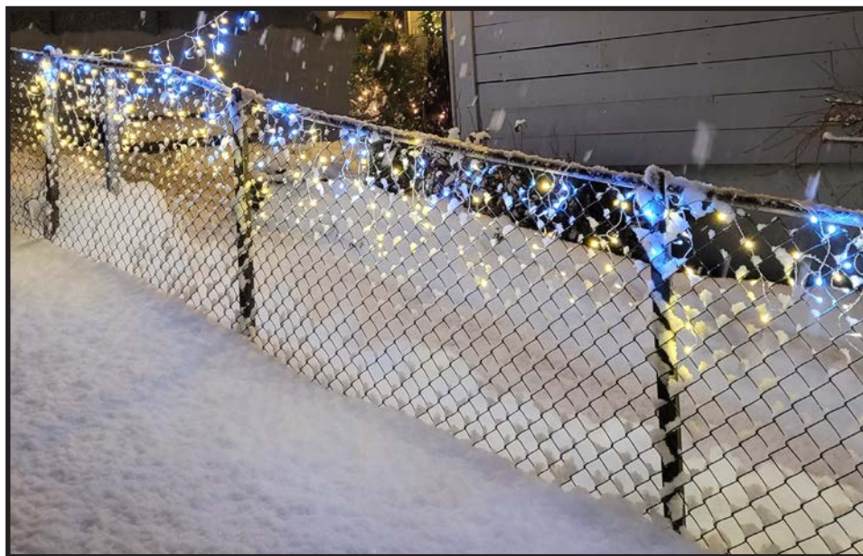
Julestemning i barnehagen

Det lyser i stille grender Av tindrende ljøs i kveld Og tusene barnehender Mot himmelen ljosa held