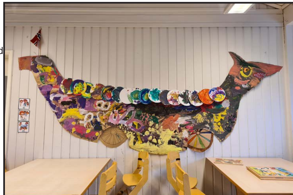
Fra fjorårets eventyrfest

Bæ, bæ lippatjamle gus dunja ullo? Gal lea manatjam vuossa dievva gåjt! Gabddas ajttjasit, ja gabddas æddnasit ja guovte skuoba unna viljatjij!