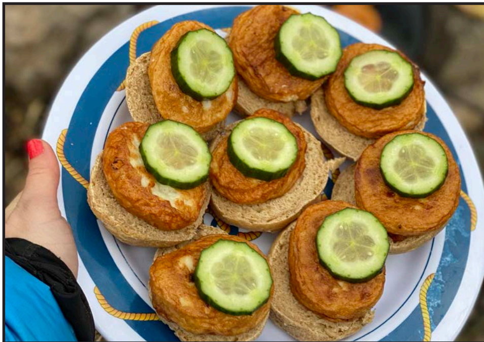
God mat på tur

Hei, hei vil du møte brannmannen Bjørnis. Rop på meg- Lille søte, tøffe, røffe. Brannbamsen Bjørnis, det er meg. Er på vei, her kommer jeg. Bjørnis, Bjørnis, her kommer Bjørnis, Bjørnis.