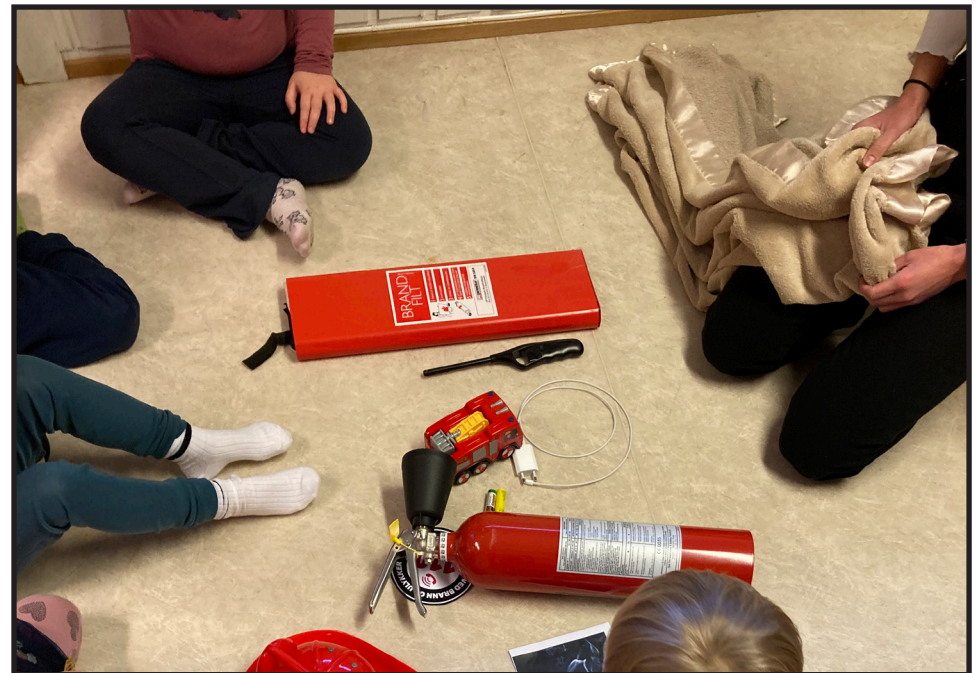
Samling med fokus på brannvern